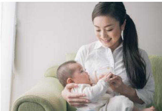
赤ちゃんのミルクや離乳食に