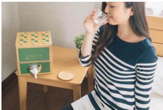
寝室で手軽に水分補給