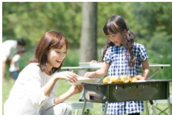
アウトドアやキャンプに