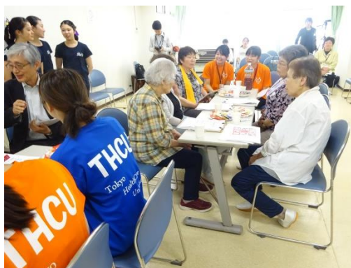
参加者と学生による「交流会」の様子