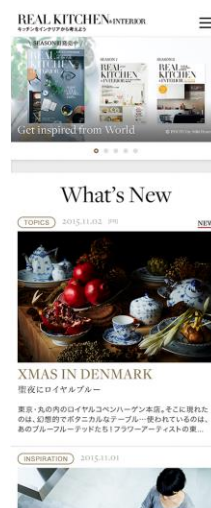
スマートフォン版