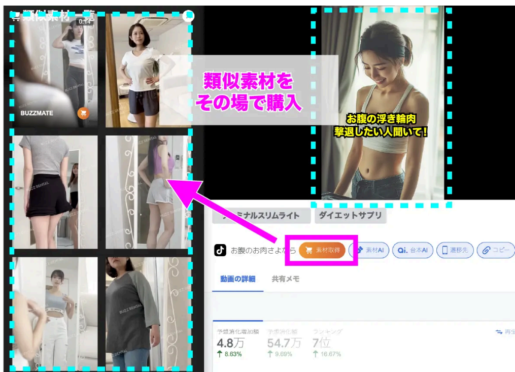
動画広告分析Pro 広告詳細画面 (画像いただき次第差し替え)

動画広告分析Proチームが、収集した広告から類似する動画素材をリスト化。気になる広告の「素材取得」をクリックし希望の素材を選択いただくと、BUZZMATEのページに遷移し、即日で素材をレンタルすることができます。