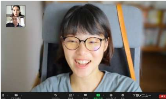
高橋へのリモートインタビュー