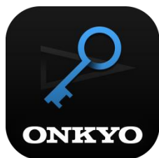
【HD プレーヤーパック】