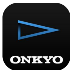
【Onkyo HF Player】

ハイレゾ音楽プレーヤーアプリや DAP(デジタルオーディオプレーヤー)カテゴリーにおいてユーザーの皆様よりさまざまなご意見を頂き反映することで、機能性と利便性をさらに高め、使いやすさの向上を図っております。