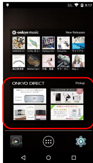
【“ONKYO DIRECT”情報を追加した表示例】 【“ピックアップ”ウィジェットをホーム画面に追加した表示例】