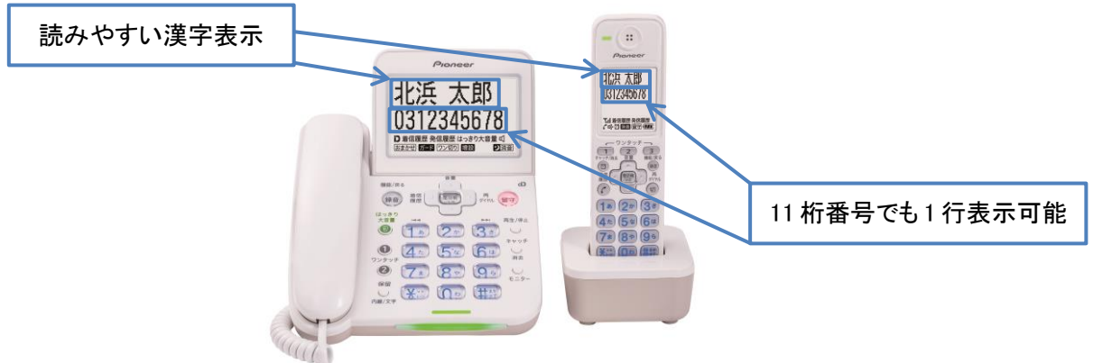
【大型液晶画面(親機・子機)】

読みやすい漢字表示に加え、視認性の高いホワイトバックライトを採用した大型液晶画面を搭載しており、親機(3.9型)、子機(2.1型)ともに、大きく見やすいことに加え、携帯電話の電話番号(11桁)も1行で表示できるなど、使いやすい仕様になっています。