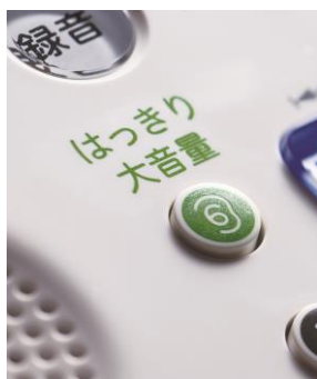
【「はっきり大音量」ボタン】

通話中に「はっきり大音量」ボタンを押すと、受話器からの相手の声が大きくなるとともに、高い音を強調するので、会話時の相手の声が聞き取りやすくなります。