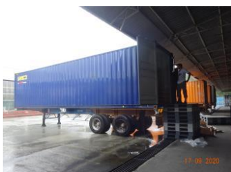
製品倉庫(コンテナ積み込み)