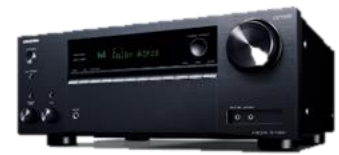
S&O が生産をする AV レシーバー

マレーシアでは、新型コロナウイルス感染症拡大の影響による行動制限令（MCO）が3月下旬から実施されました。5月に入り、マレーシア政府は厳格な条件のもとに行動制限令を段階的に緩和しましたが、その経過中、S&O は緩和措置に先立つ申請を行い、政府の許認可を得たことにより、4月中旬からいち早く工場の稼働を再開し、現在も新型コロナウイルス感染症予防対策を行いながら生産活動を継続しております。