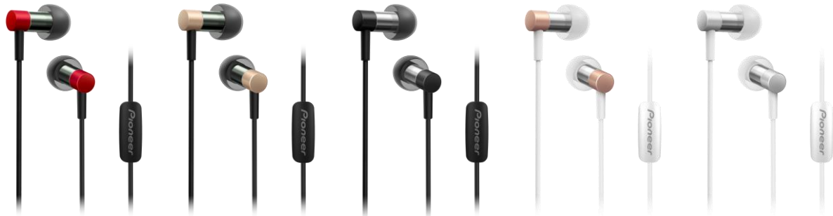
【SE-CH3T(R)】 【SE-CH3T(G)】 【SE-CH3T(B)】 【SE-CH3T(P)】 【SE-CH3T(S)】

伸びのある高域を実現するグラフェン ※ コート振動板採用のマイクロドライバーを搭載 小型・軽量で快適な装着感を実現するハイレゾ音源対応インナーイヤーヘッドホン“CH3”を新発売