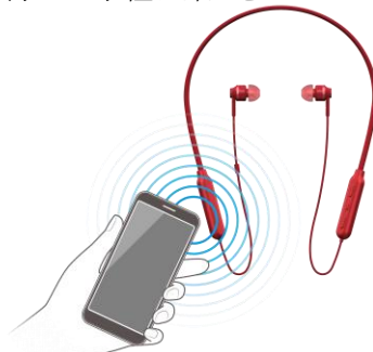
【NFC 機能搭載の Bluetooth®対応機器と簡単接続】

NFC 機能を搭載した Bluetooth®対応のスマートフォンや携帯電話、DAP などを本機にかざすだけで簡単に接続ができるので、保存した楽曲などをワイヤレス再生で手軽に楽しむことができます。