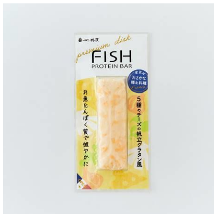
フィッシュプロテインバー プレミアムディッシュ