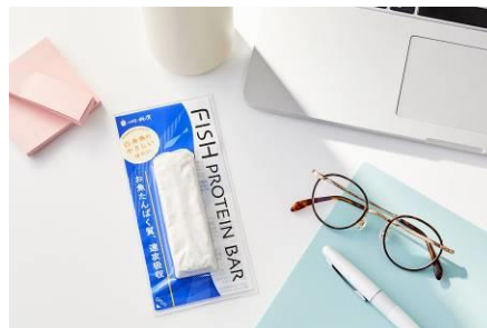
仕事の合間や移動中に