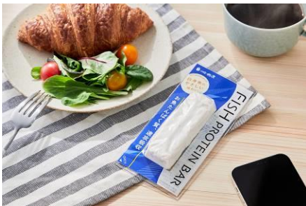
いつもの朝食にタンパク質をプラス