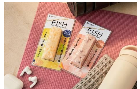
トレーニング前後のタンパク質補給に