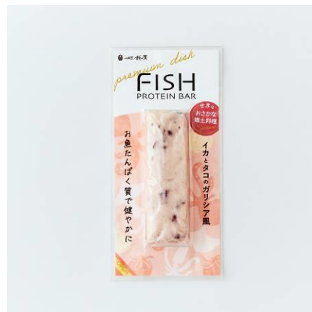
フィッシュプロテインバー プレミアムディッシュ