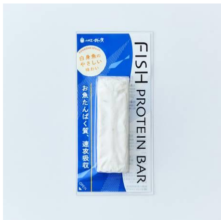
フィッシュプロテインバー プレーン