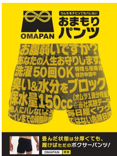
商品パッケージ（表面）