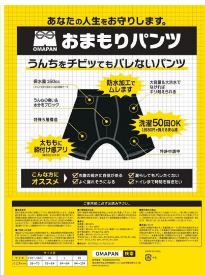
商品パッケージ（裏面）