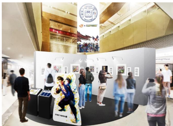
「THE CAPCOM ミュージアム in 名古屋」(イメージ)