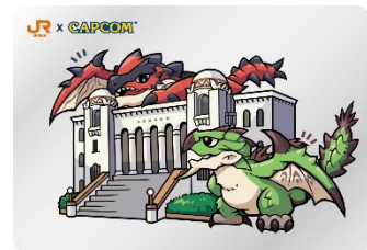
「カプ旅ステッカー」（イメージ）