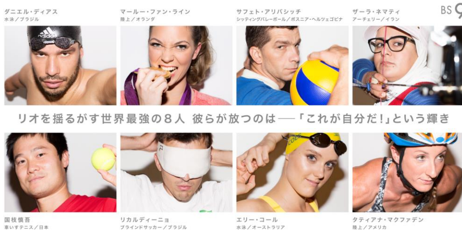
リオを揺るがす世界最強の8人 彼らが放つのは——「これが自分だ!」という輝き