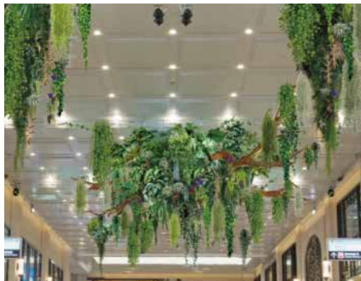
大阪梅田ツインタワーズ・ノース1階 南北コンコース 望月 虹太 「“GREEN SEED” 第2章 ～根付き、そして育む。～」