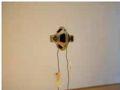
アートコートギャラリー 今井 祝雄 「今井祝雄の音」