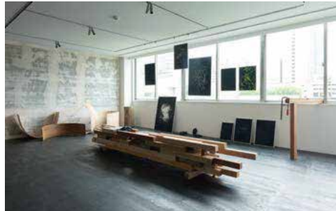
TANYE Gallery TANYE 「STRING」