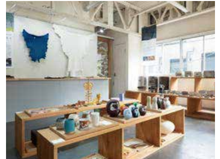
COTO MONO MICHI AT PARK SIDE STORE CEMENT PRODUCE DESIGN 「MATE+ REAL ～素材と技術の回廊～」