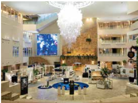
阪急うめだ本店 DAISY BALLOON 「根“生命の集積”」