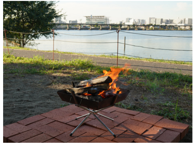
大井ふ頭はぜつき磯バーベキュー場