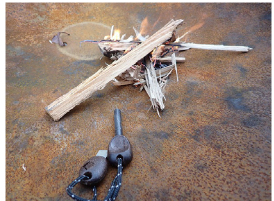
LIGHT MY FIRE ファイヤースチールスカウトを無料レンタル