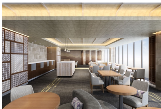
エグゼクティブラウンジ（イメージ画像）