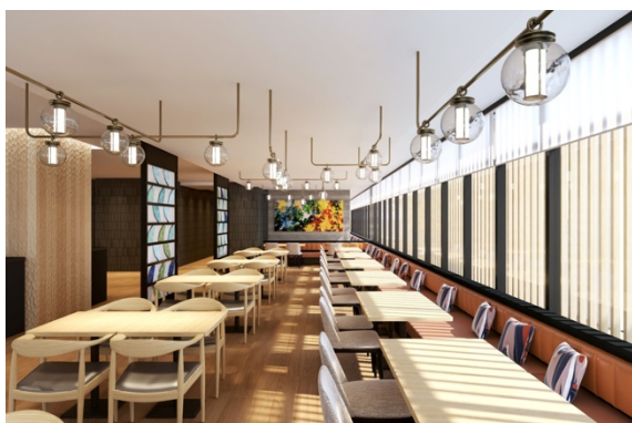
オールデイダイニング（イメージ画像）