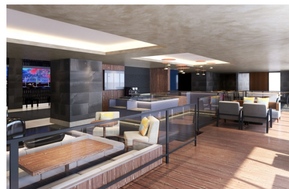
カフェ&バー（イメージ画像）