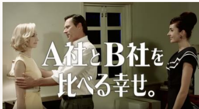
引越し侍TV-CM 「エーシャ」篇 2015年1月公開