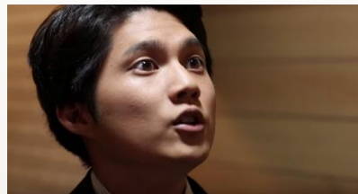
引越し侍Web限定動画 実写版「族」篇 2015年10月公開