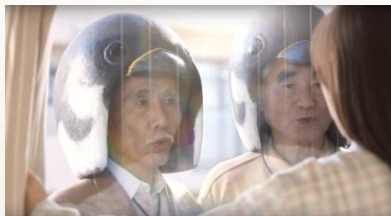
引越し侍TV-CM 「朝」篇 2012年1月公開

「引越し侍」はこれまでも、独創的でユニークなCMを 様々なところで多数、展開してきました。