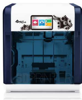
<ダヴィンチ 1.1 Plus>