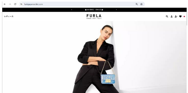
▲左画像が本物 EC サイト、右画像が偽の EC ショップ