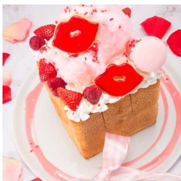
ふわふわのハニトー ¥1,490