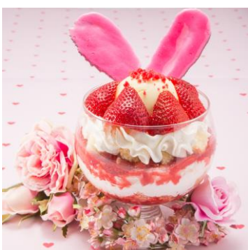
ショートケーキ風♡パフェ ¥1,290