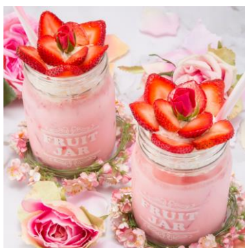
いちごが咲いた♪いちごみるく ¥790 チョコミント♡エンジェルパフェ ¥860