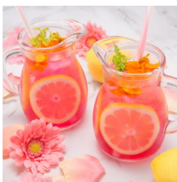
さっぱり♪ピンクレモンスカッシュ ¥730