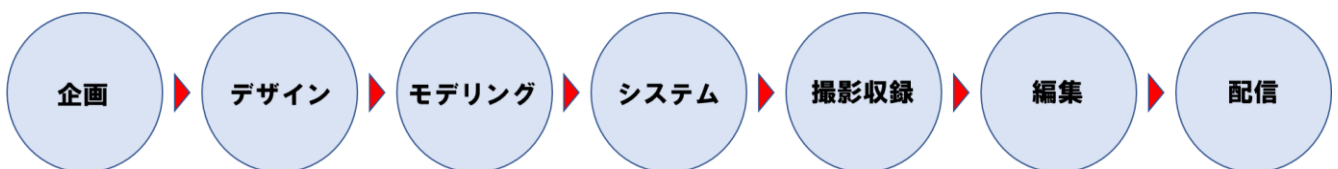
▲主な VTuber 制作の流れ

6 月には VTuber の収録や配信が行える専用スタジオもオープン予定で、多様なオーダーにお応えできる環境を整えてまいります。なお、当事業部では、モノビット社が複数人対応型 VR/AR コンテンツを行ってきた知見と、自社開発のリアルタイム通信エンジンの技術を活かし、VTuber 向けの多人数参加型エンターテインメントコンテンツの研究開発も行ってまいります。