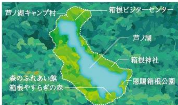
今回認定された「箱根芦ノ湖森林セラピー®基地」

「森林セラピー®ロード」とは、フィールド生理心理実験に基づき、専門家による科学的効果の検証がなされて認定された散策路を指します。森林セラピー®ロードは、主に緩い傾斜で構成されており、一般の歩道よりも道幅を広く取り、歩きやすさを考慮するなどの配慮がされたコースを中心に選定されています。