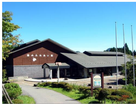
基地拠点「森のふれあい館」外観