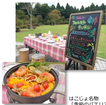
はこじょ名物 「季節のパエリア」