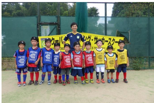
※画像は実施イメージです。

幼児&小学生を対象とした多くのサッカースクールは、フットサルコートで開催していますが、テニスコートでのサッカースクールの開催は珍しく、ユニークな運営形態です。