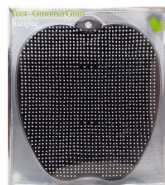
ストーンホワイト