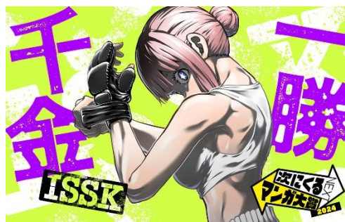
○サンドロピッチ・ヤバ子、MAAM/小学館

女子×裏格闘×団体運営=???『ダンベル何キロ持てる?』の原作サンドロピッチ・ヤバ子×作画MAAMのタッグで贈る、女子専門の裏格闘団体運営ドラマ！