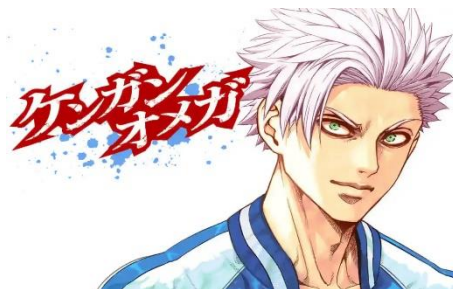
○サンドロピッチ・ヤバ子、だるめおん/小学館