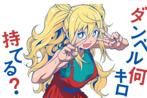
○サンドロピッチ・ヤバ子、MAAM/小学館

筋トレ&ダイエットで理想のカラダを目指す、女子高生たちの「肉体改造コメディー」!!読むプロテインを摂取して、あなたも一緒にナイスバルクを目指しましょう!! MAAM&『ケンガンアシュラ』原作のサンドロピッチ・ヤバ子のコンビで描く、筋トレ実践型(?)マンガのはじまりです♪