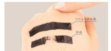
※人工汗液を3回塗布し、擦った状態で比較

3回水をかけてこすっても落ちにくくどんなシーンでも心強い、水・汗・涙に強いウォータープルーフタイプ。また、簡単にこすらず落とせるお湯落ちタイプで、メイクオフの時までまつ毛・目元への負担がなくなるようこだわりの設計です。