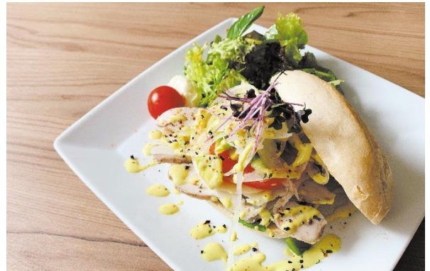
②ホテルオリジナル「自家製サラダ鶏ハムとモッツアレラのバーガー」