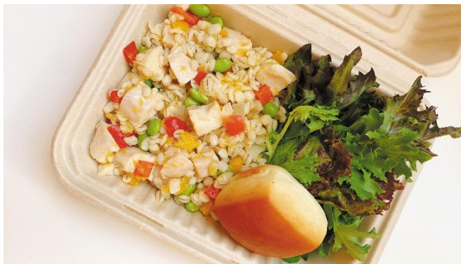
① 料理長特別メニュー「押し麦・鶏ささみ・オレンジのサラダ」

② 上記特別メニュー以外をご希望の方には、ホテルオリジナルバーガー「ヘルシー版」をレストランにてご用意(レストラン営業時間 7:00~10:00)