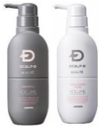
スカルプD ポーテ 脂性肌セット 7,800円(税込)