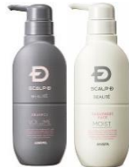
スカルプD ポーテ 混合肌セット 7,800円(税込)