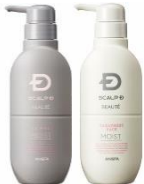
スカルプD ポーテ 乾燥肌セット 7,800円(税込)