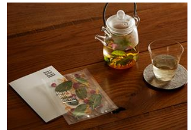
フラワーハーブティー