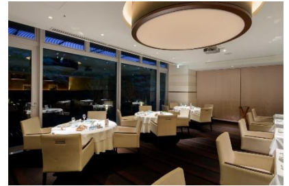
レストラン外装・内装 / コラボレーションメニュー一例