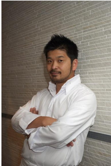
本場フランスのミシュラン 一つ星を外国人最年少で獲 得した松嶋啓介シェフ