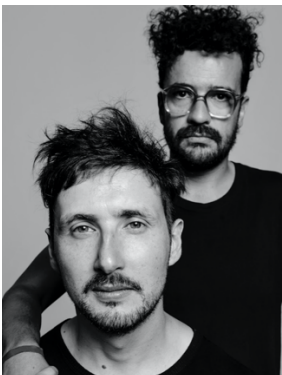
ホアキン・コシー ニャ（チリ）