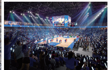
新アリーナ整備イメージ(内観) 【岡山市『多目的施設(アリーナ)整備に関する基本計画素案』より】