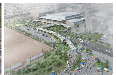
新アリーナ整備イメージ(外観) 【岡山市『多目的施設(アリーナ)整備に関する基本計画素案』より】