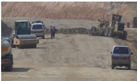
＜山岳部バイパス道建設状況＞

そんな中、当社では長期にわたる調査・トライアルを繰り返し、 国境陸送混載便は小ロットの貨物に対して価格的にも納期的にも非常に魅力的である という結論を出すに至りました。