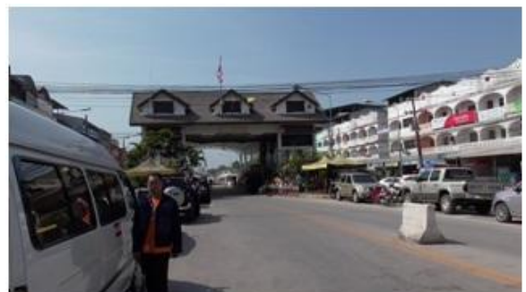
<タイ-ミャンマー間国境>

タイからミャンマーに入る国境陸送ルートに関し、当社の特徴は、大型物流でなく、中小企業も安心して使える混載物流に焦点を絞っている点です。6年前より国境物流に関わり、その後ヤンゴンに中小企業向けのビジネスサポート会社と物流子会社を設立。現地の会社や組織との様々なつながりにより人的コネクションを形成し、タイ及びミャンマーで国境物流を主に営業する会社と業務提携を進めてきました。