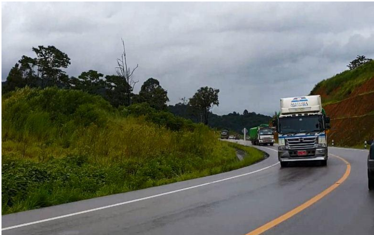
<2015年8月末に開通したミャンマー山岳部を迂回する新バイパス道路>

また、アメリカ経済制裁等の影響を受けている港湾貨物や航空貨物の混乱を避ける第3のルートとしても注目を集めており、国境物流の重要度が更に増すことは間違いないと思われる。