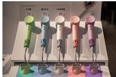
Laifen 展示ブースの様子

※年末年始は営業時間が変更となる場合がございます。最新情報は蔦屋家電+公式サイトをご確認ください。