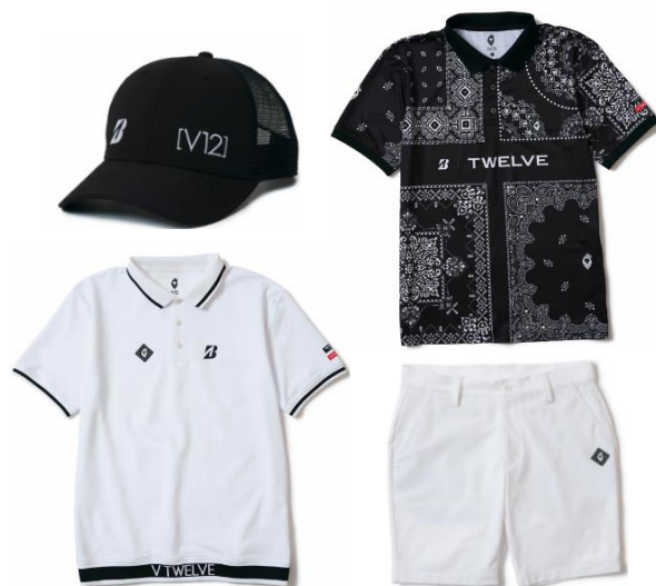
BRIDGESTONE GOLF×V12 コラボモデル