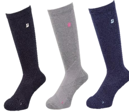
BK GE NA