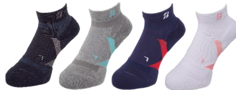
BK GE NA WH