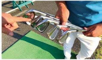
度重なるプロ評価にてソール形状を ブラッシュアップ