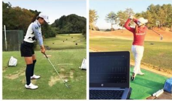
女子プロ・当社モニターを中心に評価を実施