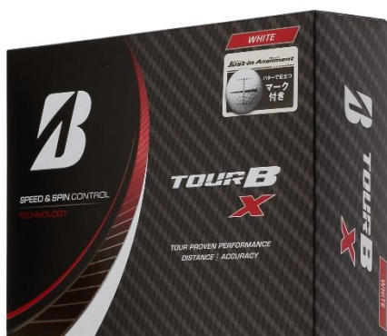
【TOUR B X Just-in Alignment】