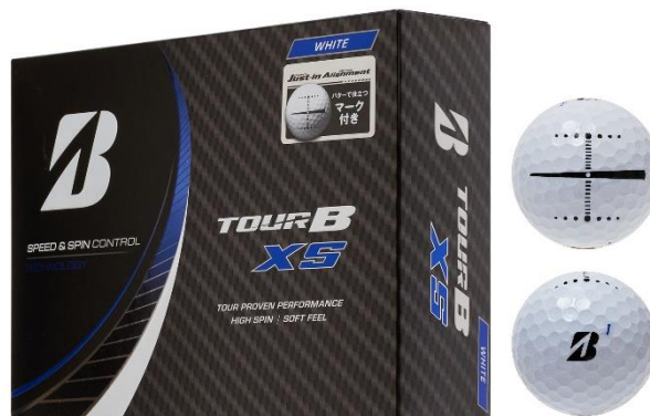
【TOUR B XS Just-in Alignment】