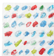
マルチクロス サイズ : 50 × 50 cm 2色 ¥1,800- (税抜)