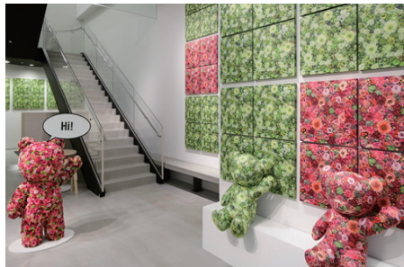
ニコライ・バーグマン × ファミリア ニコライ氏の花の世界に彩られた、いつもとは少し違ったアーティストックなファミちゃんが登場しました。

ファミリア銀座本店 1F イベントスペース「CUBiE (キュービー)」は、「体験」と「感動」を通じて子どもの可能性をクリエイトする場として開設されました。ファミリアは、洋服をはじめとする、子どもの頃に身に付けるものはもちろんのこと、初めて目にするアート、体験することのすべてが子どもの未来につながると考えています。2014年に開設して以来、フラワーアーティストのニコライ・バーグマン氏、書家の中塚翠濤氏、陶芸家の鹿兒島睦氏、テキスタイルデザイナーの鈴木マサル氏など、さまざまなジャンルで国際的に活躍するアーティストとのコラボレーションによる企画展示やワークショップイベントを通して、子どもたちの可能性に触れる「本物」を発信しています。