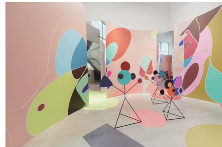
『コトバノオモチャ箱』～PLAY ENJOY SMILE～ 書家の中塚翠濤氏と3度目のコラボレーション企画。書のアニメーションや、万華鏡の中に入り込んだような体感ができる空間展示と共に、中塚氏による書のワークショップを開催。