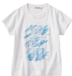
Tシャツ サイズ : 100 ~ 120 cm ¥3,500- (税抜)

本展のオフィシャルグッズとして、鈴木マサルデザインによるTシャツとマルチクロスを販売致します。 鈴木マサル氏が描いた、アーティスティックなおさかながプリントされたTシャツは、夏に涼しげな印象で男の子にも女の子にもおすすめです。 マルチクロスは、通常のハンカチより一回り大きなサイズ(50×50cm)なので、お弁当を包んだり、バンダナとしてファッションのアクセントにと、子どもも大人もご使用いただけます。