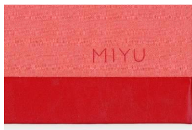
*イニシャル刺繍イメージ画像