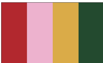
持ち手・パイピングの合成皮革(8色)