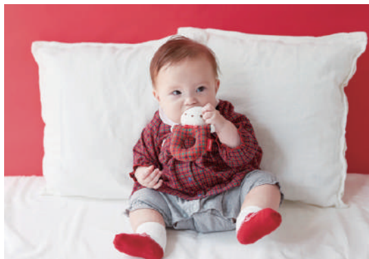
New Born 50~70cm

https://www.familiar.co.jp/stylebook/index.html