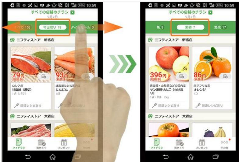
<スワイプでのチラシ切り替えイメージ>