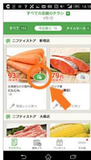
<マイチラシでのマーク表示>