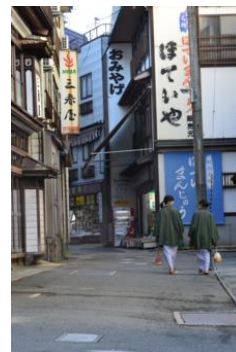
肘折温泉 湯めぐり