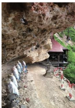
パワースポット地蔵倉