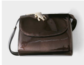
■ ABAG patent glitter グリッターレザー (ダークブラウン) 本体価格: 90,000yen(+ tax)