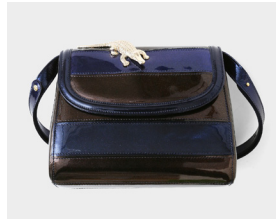
■ ABAG patent patchwork glitter グリッターレザー (パッチワーク) 本体価格: 110,000yen(+ tax)