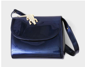
■ ABAG patent glitter グリッターレザー (ダークブルー) 本体価格: 90,000yen(+ tax)