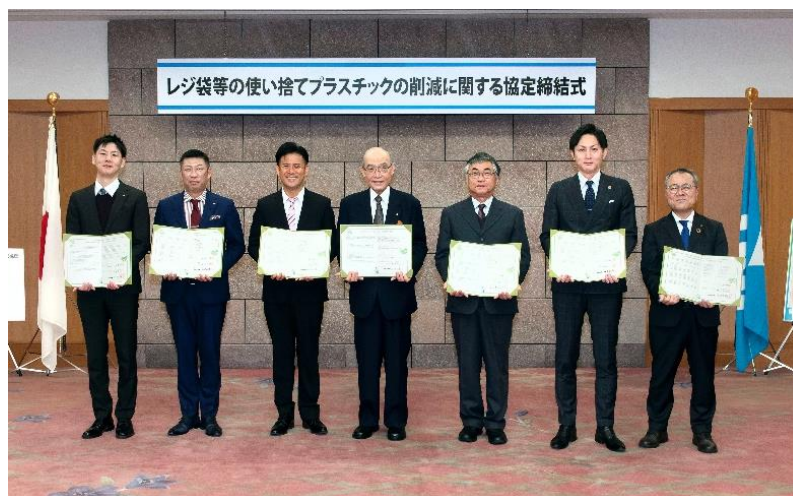
石川県庁にて行われた協定締結式 2022年2月