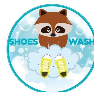
子供売り場の足もとシートや、ミラーシート