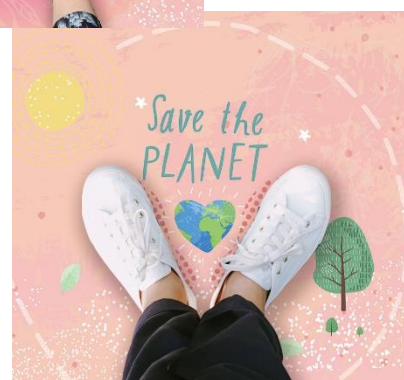
足もと用撮影シート