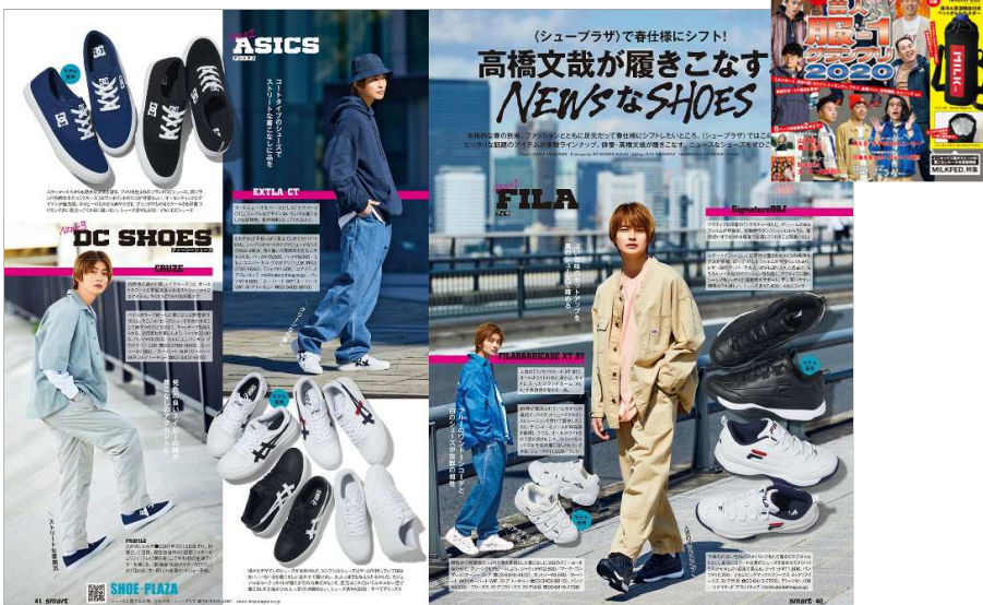
smart 2020年6月号

俳優、モデルとして活躍中の高橋文哉さんが、メンズファッション雑誌「smart」で着こなす春のコーディネートは必見です。